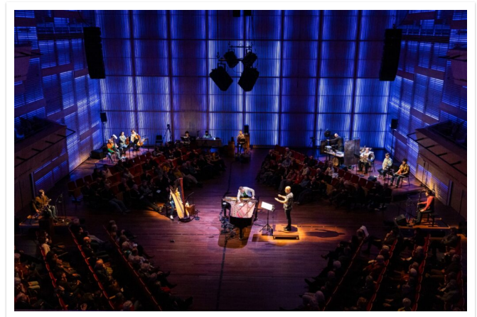
De setting van 'inhabit_inhibit.

Want Prins mag dan al eerder hebben laten horen en zien dat hij één van de meest originele componisten van dit moment is, met dit 'inhabit_inhibit' zet hij nog weer een paar stappen vooruit. Allereerst vanwege een aantal concepten die hij in dit stuk uitwerkte en die je zou kunnen zien als analogieën voor wat er wereldwijd met ons klimaat aan de gang is. Eén van de meest interessante aspecten die Morton aansnijdt is dat we niet kunnen ontsnappen aan deze catastrofe, hoe graag we dat wellicht ook zouden willen, er is immers maar één aarde. Bij Prins krijgt dit zijn beslag middels de opstelling van de musici. Wij zitten letterlijk te midden van hen. Op de vier hoeken van de zaal staan podia, met elk vier akoestisch spelende musici: blazers, strijkers en slagwerk. Daartussen, in de vorm van een kruis, zitten vier blazers, basfluit, basklarinet, bashobo en baritonsax en in het midden dus voor onze neus vinden we een piano en een harp. Daarnaast is er elektronica die zich overal tussendoor beweegt. Het geluid komt dus van alle kanten en vermengt zich zodanig met elkaar dat op menig moment totaal niet meer valt uit te maken waar het vandaan komt.